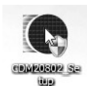
Рис. 2: Пиктограмма программы установки драйвера преобразователя